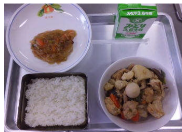
【今日の給食のメニュー】 ごはん 牛乳 和風ハンバーグ 野菜の味噌煮 715kcal

今日はごはんをみんなもりもり食べたよ。ハンバーグが特においしかったですね。いつもはおはしの忘れがあるのですが、今日は0でした。しっかり確認していたのでしょう。