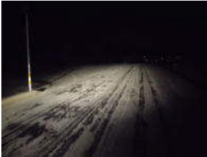
森さんの前の道 5時30分