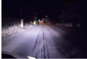
四辻の交差点前の上り坂