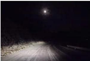
中の原の下り坂 5時30分

本日月曜日は昨日からの積雪のため登校時間を下げて10時としました。通勤や学校への送りでご迷惑をおかけすることになり申し訳ありません。学校周辺は中の原の下り坂から四辻、学校の下り坂など積雪・凍結が厳しく、徒歩でもすべる可能性が高いので安全面を考えての時間変更にさせていただきました。