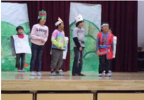
なかよし発表会 11/28(土)