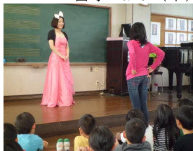
文化キャラバン 11/12(木)