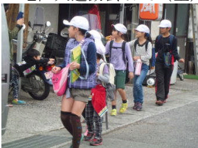
ウォークラリー 11/6(金)