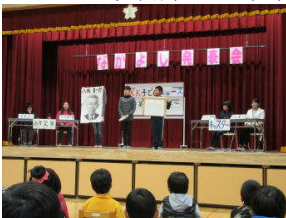
なかよし発表会 11/28(土) 4・5年社会見学 10/22(木)