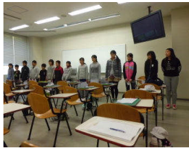
A P U 留学 10/29(木)