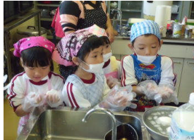
料理教室 11/4(水) 幼稚園