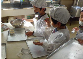
ケーキミックスに芋を入れて混ぜますよ。