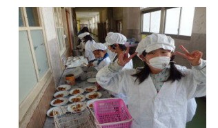
◇2・3年生の給食の準備風景(割烹着とても似合っています。協力してできたかな?)