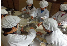
アルミ容器にスプーンで入れますよ。