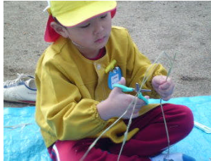
あかねさんあみさんさとるさん器用です。