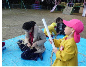
こうしさんこうだいさんはるさん頑張っています。大野先生うまいです。