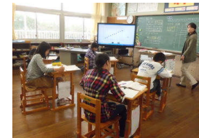
6年生：比例のグラフ