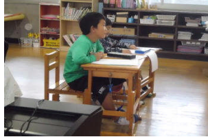
3年生の盆踊り学習