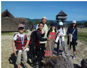
弥生人になりきって