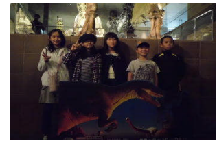
いのちの旅博物館