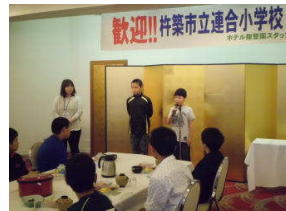
朝食の挨拶は北杵築が当番