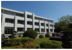
白い校舎 4月号 No.7