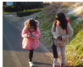
学校の下芋畑の坂

今日は雪が少し積もっていましたが予想に反しておだやかだったです。児童は元気に登校しています。