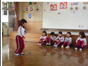
☆オペレッタなかよし忍者