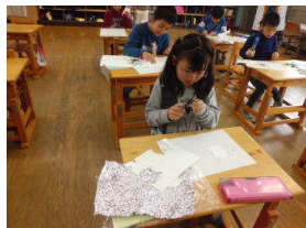
2・3年図工(紙版画) 4年理科(星座調べ)