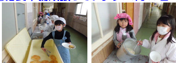
【2・3年生の準備風景 12時30分】