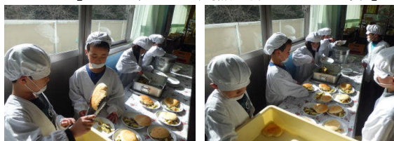
【1年生の準備風景 12時35分】