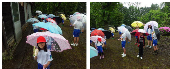
【みんなでおまいりしました。10時50分】

お平地区の公民館で境内にある「おこぼ様」3体を館内にお祭りして料理やお菓子をお供えていました。おこぼさまは「弘法大師：空海」でその誕生をお祝いする会のようです。