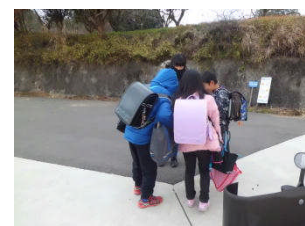
絵本を見ているよ。

学校の下は四辻と鴨川からの合流点なので、楽しいお話が毎日あります。今朝は図書館から借りた本をみんなで見えています。