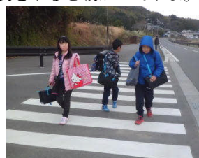
7 時 50 分

今朝は曇り空で 7 時 30 分でも薄暗くて雲がかかっていて暗かったです。学校の下には 7 時 45 分ぐらいが一番多く集まってきます。8 時に黄色のコミュニティーバスが通る時に最後の友だちが坂を上っていきます。図書館の本屋授業道具を抱えている 1 年生もいます。とても頑張っているので感心します。寒くなったので耳当てた手袋をすると暖かいですよ。