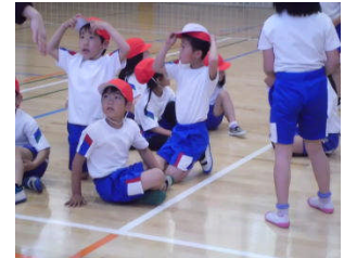
今度は帽子を逆にしてゲームをするよ。