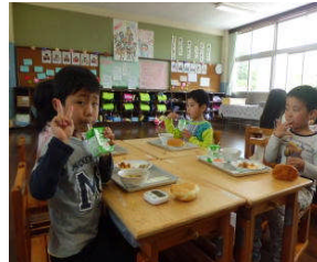
給食おいしいよ。 12:35分

◆1年生は4時間目は体育で2年生と合同で体育館で鬼ごっこやスキップなどして楽しかったよ。体を動かしたり走ったりすると、とても楽しくなります。勉強や運動・遊びに頑張る1年生になってください。ときどき疲れたり友だちと気持ちがあわずにすれ違って、ニコニコ笑顔がなくなる友だちもいますが、すぐに仲良くなれる1年生なので明日も楽しいことがあるといいです。