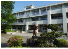
金次郎像の校舎 4月号