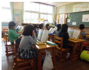
1年生：3時間目の算数 1年生：5時間目の音