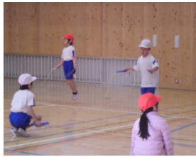
昼休みもりもり 4時間目体育

12月15日の3時間目（10時50分から11時50分）に体育館で記録会をします。ぜひお家の方に見学に来てください。すごい技を披露します。個人競技以外に長縄とびもあるので楽しみにしてください。後二週間あるので土日は家で練習する児童も多いので声援をお願いします。