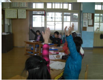
まっすぐに手をあげてはりきる子どもたち