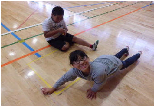
友情の木の枠づくり