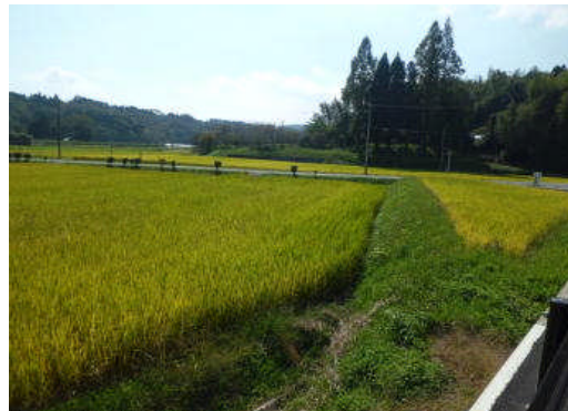
学校の入り口にある稲の生育状況（10月16日）