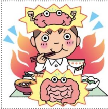
【バランスのとれた食事】